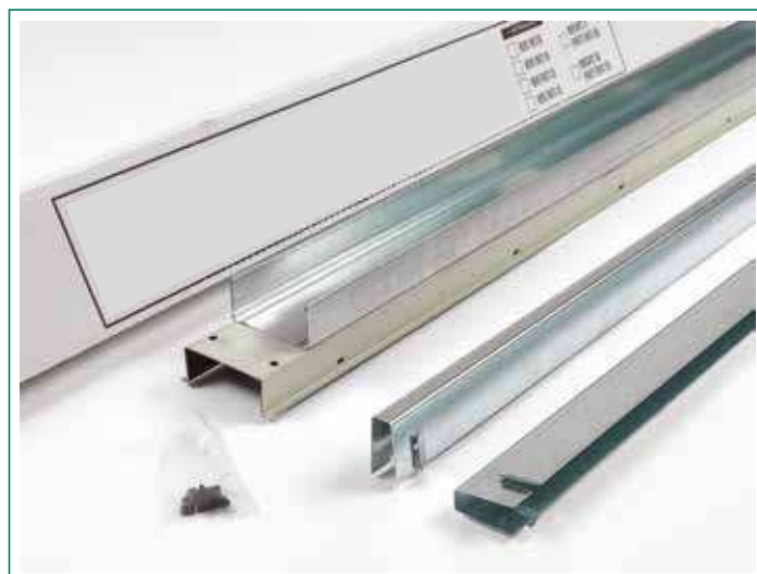
Modelo para cartón-yeso