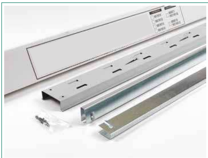
Modelo para enfoscado